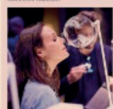
Il profumo è un'arte e un'industria. La sua essenza è ispirata da un profumo di Noo, il profumo di Noo, il profumo di Noo.

Ogni anno in Italia sono lanciati circa 300 profumi (dati Cosmetica Italia) per un valore che supera il miliardo di euro di prodotti acquistati nel nostro Paese, soprattutto in primavera dove si spendono oltre 500 milioni.