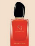
Giorgio Armani. Giorgio Armani per chi ama il profumo. La sua essenza è ispirata da un profumo di Noo, il profumo di Noo, il profumo di Noo.