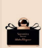
Salvatore Ferragamo. Salvatore Ferragamo per chi ama il profumo. La sua essenza è ispirata da un profumo di Noo, il profumo di Noo, il profumo di Noo.