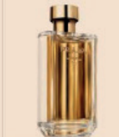
Parfums de Noo. Parfums de Noo per chi ama il profumo. La sua essenza è ispirata da un profumo di Noo, il profumo di Noo, il profumo di Noo.