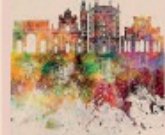
Il progetto "Parma la città del Profumo" è legato alla nomina di Capitale Italiana della Cultura 2020.

"Parma la città del Profumo" racconta due secoli di professionalità e competenza imprenditoriale che rendono la città un importante centro che ruota attorno al mondo delle fragranze. E lo fa con due mostre: "Dalle origini ai giorni nostri", al Museo Glauco Lombardi fino al 22 marzo; e "L'evoluzione e la modernità", dal 1° aprile al 30 giugno all'Ape Parma Museo.