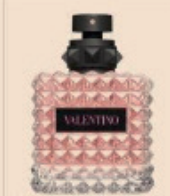
Valentino. Valentino per chi ama il profumo. La sua essenza è ispirata da un profumo di Noo, il profumo di Noo, il profumo di Noo.