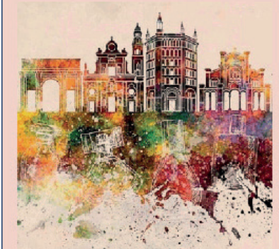
Il progetto "Parma la città del Profumo" è legato alla nomina di Capitale Italiana della Cultura 2020.

"Parma la città del Profumo" racconta duecento anni di professionalità e competenza imprenditoriale che rendono la città un importante centro che ruota attorno al mondo delle fragranze. E lo fa con due mostre: "Dalle origini ai giorni nostri", al Museo Glauco Lombardi fino al 22 marzo; e "L'evoluzione e la modernità", dal 1° aprile al 30 giugno all'Ape Parma Museo.